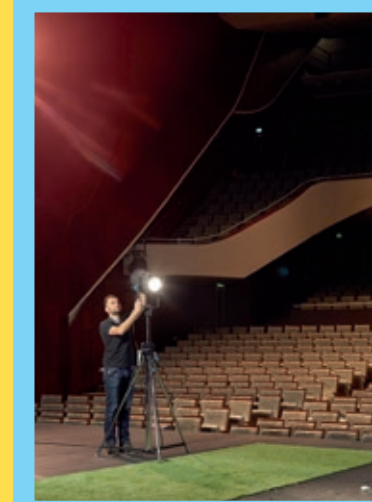
Jérôme, régisseur lumières